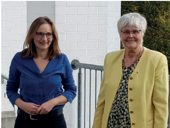
Lisa Badum und Sigrid Skarpelis-Sperk

Die Bundestagsabgeordnete Lisa Badum wurde auf der Mitgliederversammlung am 16. Oktober 2021 in Ottobrunn einstimmig zur neuen Präsidentin der Vereinigung der Deutsch-Griechischen Gesellschaften (VDGG) gewählt. Sie folgt Dr. Sigrid Skarpelis-Sperk nach, die nach 25 Jahren an der Spitze der VDGG nicht wieder kandidierte und zur Ehrenpräsidentin der VDGG ernannt wurde.