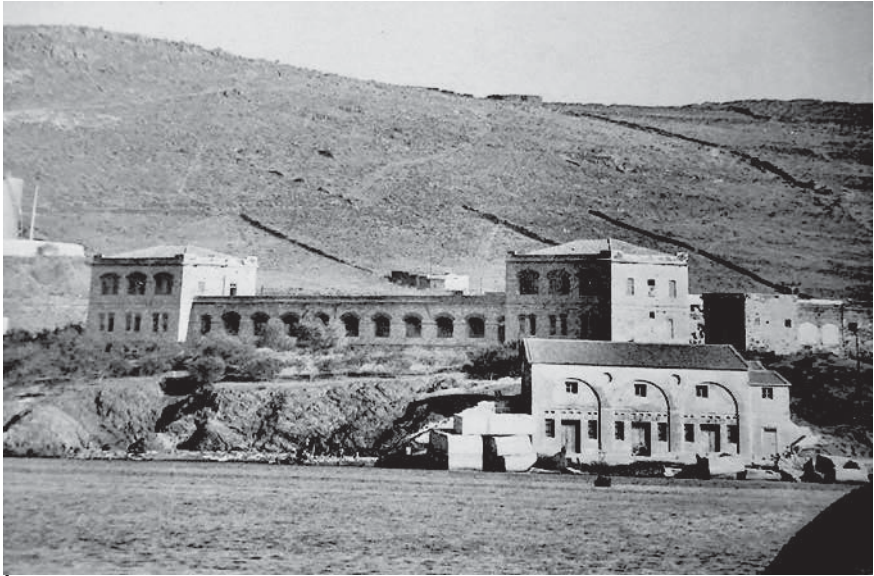
Abb. 1: Das Quarantänegebäude auf der Insel Syros