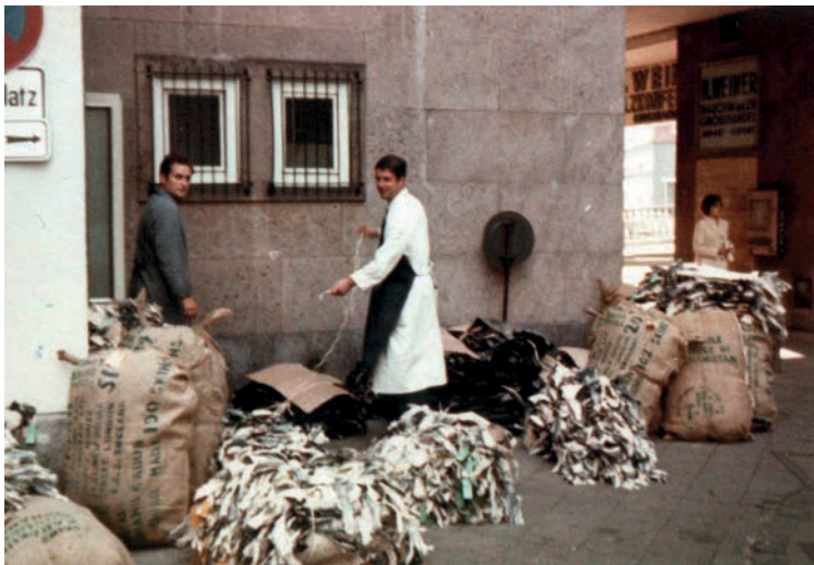
Abb. 2: Rauchwarenhändler mit Pelzfellen am Durchgang Niddastraße zur Düsseldorfer Straße, 1970

der Pelzbranche sehr gut bezahlt. Das war für viele griechische Gastarbeiter ein Anreiz, nach Frankfurt zu ziehen, um dort als Pelznäher bzw. Lohnkürschner zu arbeiten. Sie deckten also als Arbeitskräfte die Angebotsseite ab. Und so kam es, dass das Pelzhandelszentrum Frankfurt stark anwuchs und schließlich zum größten der Welt wurde. Man geht davon aus, dass in der Hochzeit über zehntausend Personen im Bahnhofsviertel in der Pelzbranche gearbeitet haben. Etwa 80 Prozent der Pelzarbeit in Frankfurt wurde dabei von griechischen Kürschnern gemacht. 4