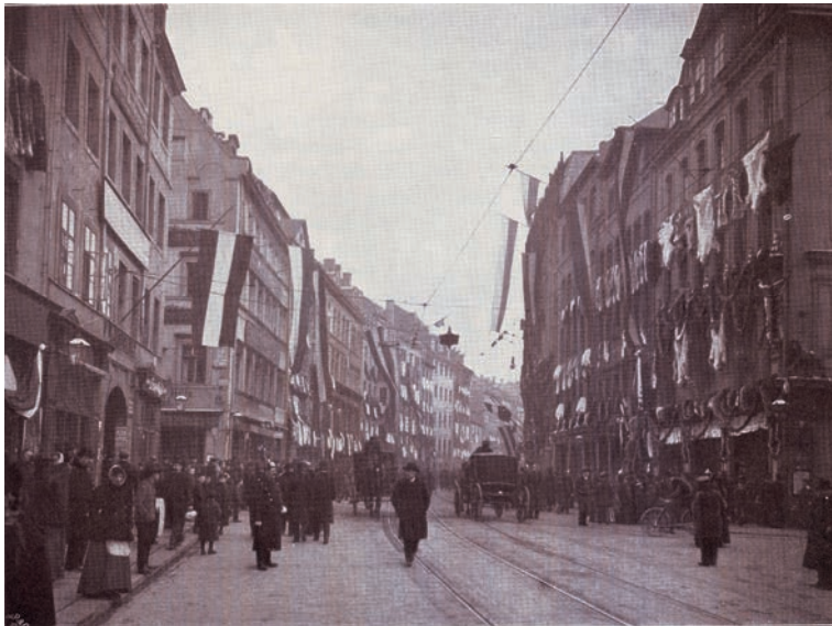
Abb. 1: Der Brühl zu Leipzig während der Messe

gab, die aus Kürschnern und Pelzhändlern und deren Familien bestand. Sie etablierten sich am „Brühl“, ein Viertel in Leipzig in der Nähe vom Hauptbahnhof. Der „Brühl“ entwickelte sich zum Synonym für das Leipziger Pelzhandelszentrum bzw. für die Rauchwarenbranche ganz allgemein.