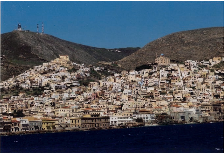
Abb.4: Ermoupolis mit Ano Syros (links) und der katholischen Kirche Ag. Georgios. Rechts die orthodoxe Anastasis-Kirche mit dem Viertel Vrontadou. Im Hintergrund links der Pyrgos, mit 440 m die höchste Erhebung der Insel

Franz Grillparzer verlässt Syros am 12.10.1843 um 19 Uhr und erreichte am 13.10. um sechs Uhr morgens Kap Sounion und später Athen.