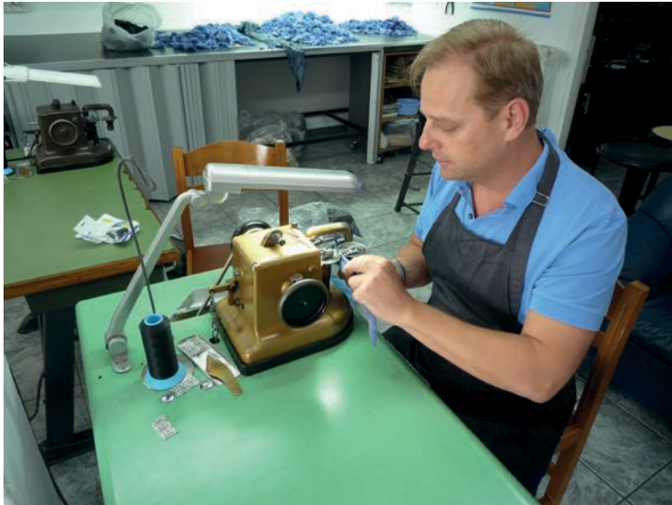
Abb. 3: Ein Kürschner aus Kastoria an der Pelznähmaschine, 2019

zusammenzunähen, die dann Tafeln oder Bodies genannt werden. Diese Halbfertigprodukte bilden dann das Ausgangsmaterial für Jacken, Mäntel und verschiedenste Pelzaccessoires. Diese Verwertung der Pelzreste nennt man auch Fellresteverarbeitung oder Pelzstückenverarbeitung. Aktuell gibt es sogar Bestrebungen, sich die Fellresteverarbeitung für diese griechische Region patentieren zu lassen.