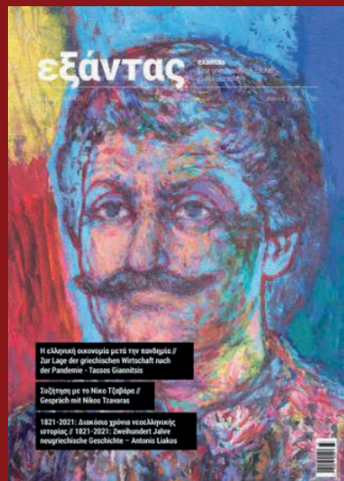
Exantas Ausgabe Nr. 33 vom Juli 2021

Der Sextant als Instrument zur Standortbestimmung auf zahlreichen Gebieten im deutsch-griechischen Verhältnis. Seit dem Heft 29 (Juli 2019) ist die Zeitschrift durchgehend zweisprachig, so dass alle Beiträge ohne Kenntnis der anderen Sprache gelesen werden können. Wer mag, kann zugleich seine Kenntnisse der anderen Sprache trainieren.