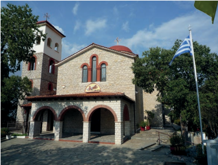
Abb. 6: Kirche Prophet Elias, 2019

Reichtum gekommen waren. Manche dieser Kaufleute haben sich als Zeichen der Verbundenheit in ihren Häusern Wandmalereien anfertigen lassen, die Städte zeigen, mit denen sie Handel getrieben haben. Neben Gemälden von Dresden, Leipzig, Wien und Budapest gibt es auch eines, das „Franckfurt am Mayn“ zeigt. Es ist aus dem 18. Jahrhundert und befindet sich im Herrenhaus Maliongas. Es ist leider nicht öffentlich zugänglich, aber eine Abbildung kann man auch online finden, z. B. unter: diablog.eu/allgemein/franckfurt-am-mayn-im-griechischen-siatista/ .