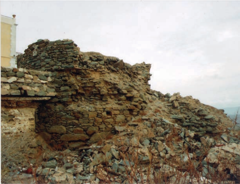
Abb. 3: Kap Vaporia mit den Resten der Windmühlengrundamente

Kehren wir nach Syros zurück. Bevor der Dichter am 10. Oktober die Windmühlhöhe erstieg, nahm er mit seinem Reisebegleiter am Fuße der Vaporia bei starkem Südwind ein Bad im Meere, was gerade nicht für die ihm aufgeschwätzte Hypochondrie spricht. Er muss dort ins Meer gestiegen sein, wo die Syrioten bis weit über die Jahrhundertwende zu Euphemie ihre thalassische Zeremonie abhielten (ΕΛΕΥΘΕΡΙΟΥ 1993: 140). Zusammen mit dem mit eigenen Händen vollzogenen Wegebau in der Quarantäne spricht das Baden im Meer bei einem Seegang von vermutlich 5–6 Beaufortgraden (= 28-50 km/h Windtätigkeit) für einen recht mutigen, auch körperlichen Einsatz. Allerdings bezeichnete Grillparzer sich bereits bei seiner Abreise als einen, der seine Reise als „Gewaltmittel“ gegen „seine hypochondrische Unentschlossenheit“ sah (5).