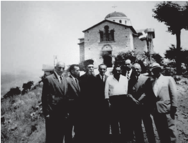
Abb. 5: Einweihung der Prophet-Elias-Kirche auf der Halbinsel Kastoria 1962 oder 1963

Konkrete Spuren, die Frankfurt in den griechischen Pelzstädten hinterlassen hat, sind dagegen schon seltener zu finden. Am westlichen Ufer des Orestiada-Sees erstreckt sich eine bis zu 250 Meter hohe Halbinsel mitten in den See hinein. Sie ist stark bewaldet und deshalb weitgehend unbebaut. Die Stadt Kastoria schmiegte sich entlang des Halses der Halbinsel und erstreckt sich ein Stück weit entlang des westlichen Ufers. Auf dieser Halbinsel, etwas oberhalb und abseits des bebauten Stadtgebiets, wurde 1962 oder 1963 die neu gebaute Prophet-Elias-Kirche geweiht. Interessant daran ist, dass eine ganze Reihe von kastorianischen Kürschnern aus Deutschland und insbesondere aus Frankfurt seinerzeit den Bau dieser Kirche gesponsert haben.