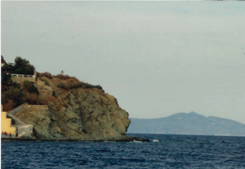
Abb. 2: Das Kap Vaporia mit dem tophilen ehemaligen Windmühlenstandort, im Hintergrund die Insel Tinos

abreisen sollte. Damit wird auch das Merkmal der Spannung als konstitutives Element seines Landschaftserlebnisses sichtbar (RIEDL 2018: 39ff.).